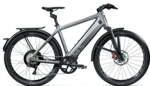
ST5 | Suspension Fork 27.5" Deep Black & Suspension Seatpost Kinect