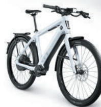
Option Pinion (cf. fiche technique séparée)