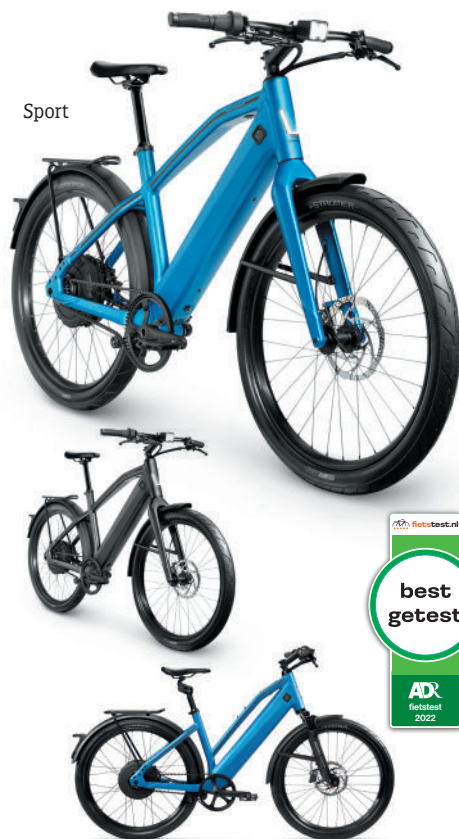
Comfort, Suspension Fork 27.5" Raidon Black & Suspension Seatpost Kinect