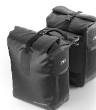
Stromer Bag Antwerp 2 x 20 l