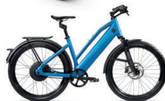
Comfort, Suspension Fork 27.5" Raidon Black & Suspension Seatpost Kinekt